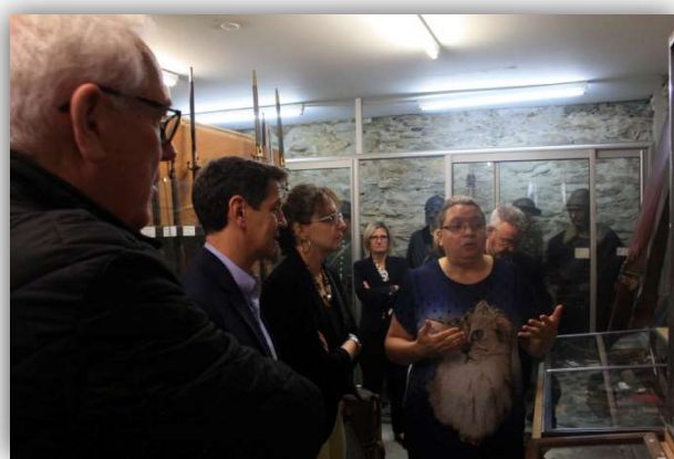
Visite du Président du département