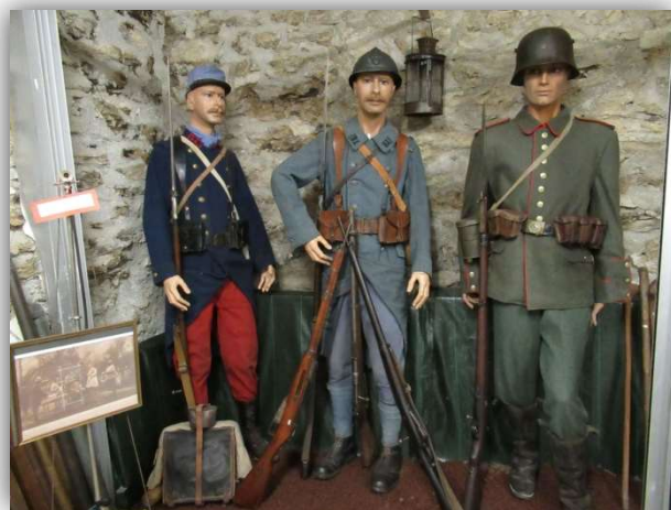
Isolation au sol dans les vitrines de mannequins