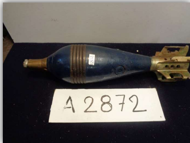
Tous les objets ont été photographiés et inventoriés